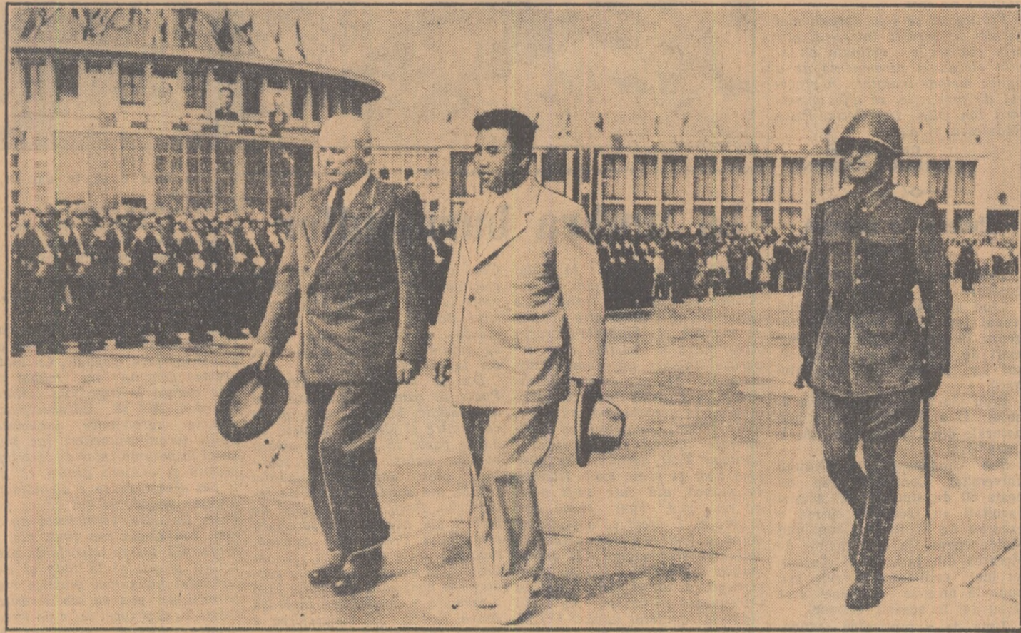
Tovarășii Kim Ir Sen și Chivu Stoica trec în revistă garda de onoare

In materie de prietenie obisnuitele criterii geografice n-au avut hotarilor. Nu-i vorba de o sentinta pretențioasă, ci de o realitate simplă, vizibilă, de un adevăr unanim recunoscut. Revedind însemnările din aceste zile, impresiile notate în goană, gândeam că s-ar putea spune că ultimul deceniu a născut o nouă geografie — cea a prieteniei. Geografia prieteniei sfidează legile spațiului, nu cunoaște frontiere. Geografia aceasta o întocmesc simțămintele oamenilor, năzuințele și speranțele lor.