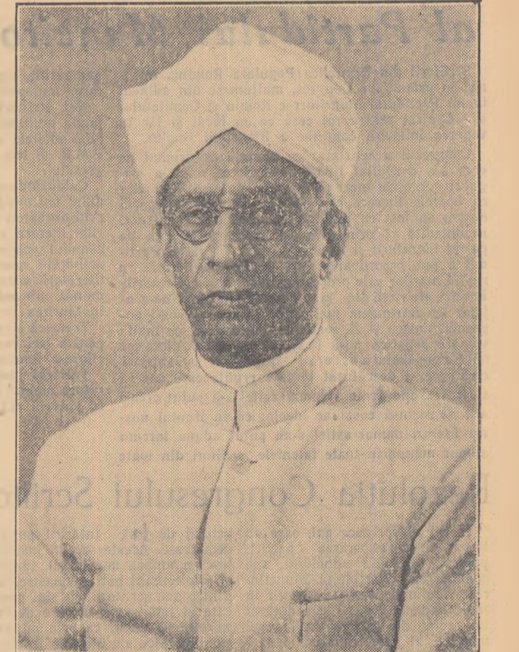
Dr. Sarvapalli Radhakrishnan