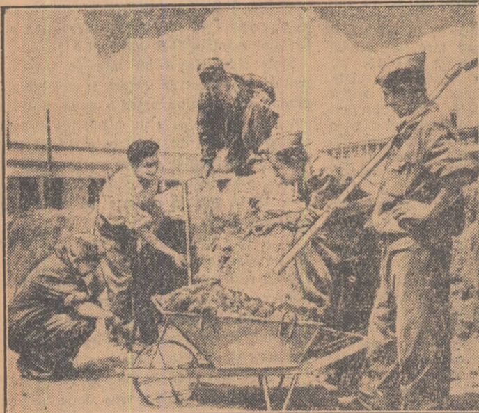
Băieții sînt veseli. Și astăzi norma a fost îndeplinită. Șantierul tineretului de la Combinatul de faianță și sticlă de lângă Sighișoara a atras aici numeroși constructori din împrejurimi.