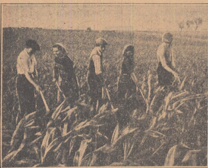
Fotografia vă înfățișează o echipă de tineri colectivști din comuna Gighera, ralonul Gura-Jilului, prășind a doua oară porumbul. Sînt frunțași în muncă, asemenea multor tineri colectivști din Gighera.