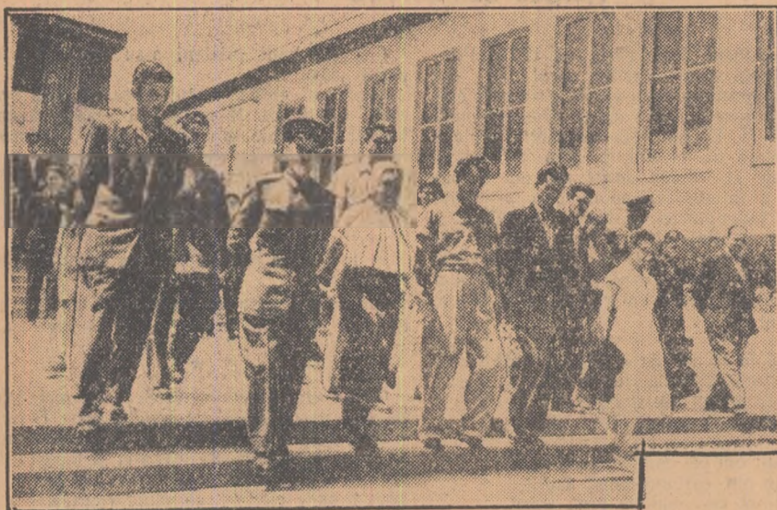
Fruntași ai muncii — reprezentanți ai tineretului de pe întregul cuprins al patriei noastre au sosit în Capitală; ei aduc Congresului mesajul întregului nostru tineret. În fotografie: un grup de delegați la Congres.

Azi se deschide la București al II-lea Congres al Uniunii Tineretului Muncitor