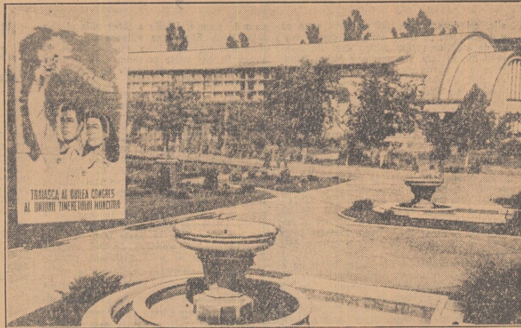
Sala „Dinamo” — aici se vor desfășura lucrările celui de al II-lea Congres al U.T.M.