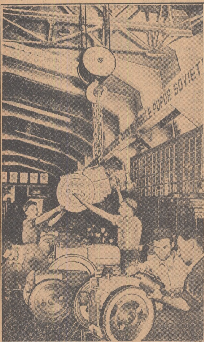
Cinci motoare de 6-8 c.p. realizate din economii — iată darul făcut Congresului de către brigada utemistă de la secția montaj-motoare a uzinelor „Independența” Sibiu.