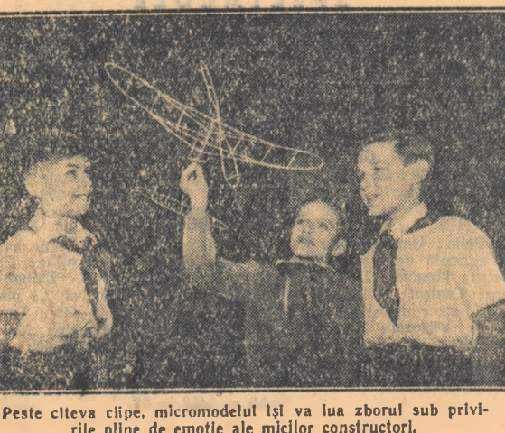
Peste cîteva clipe, micromodelul își va lua zborul sub privirile pline de emoție ale micilor constructori.

RASPUNS: Sînt. Unele dintre ele ne supără chiar destul de mult la țară. În perioada de iarnă antrenamentele se fac foarte greu din cauza singurei baze sportive existente în Orașul Ploști: sala stadionului „Flacăra” (Energetica). În perioada de vară, joia sînt meciuri de fotbal, iar cînd schimbă este divizie de atletism, nu se mai poate face antrenament pe stadion. Aceasta face ca de multe ori activitatea noastră să nu poată decurge normal. În această direcție cred că și secția de învățămînt a statului popular orășeneș are o vină. Ea ar putea să ne ajute mult mai mult și în această direcție. De asemenea și Ministerul Învățămîntului de care aparține școala. Una din greutățile cele mai mari însă o consider lipsa de înțelegere de care dau dovadă profesorii de la școlile care nu trimt elevii la școlile sportive, profesorii și directorii de liceu „A. Toma”. Școala medie nr. 3 și celelalte școli elementare. De asemenea lipsa de cadre — datorită și secției orășenești de învățămînt — stagnează oarecum desfășurarea activității în bune condiții a unor secții (de exemplu secția de voleibol). Acestea sînt cîteva din greutățile care mai stau încă în fața Școlii sportive de elevi din Ploști. Consider că la remedierea lor, cît și la îmbunătățirea activității întregii școli, o contribuție serioasă o poate aduce comitetul orășeneș U.T.M. Din păcate, deocamdată, se pare că acesta nici nu știe de existența noastră.