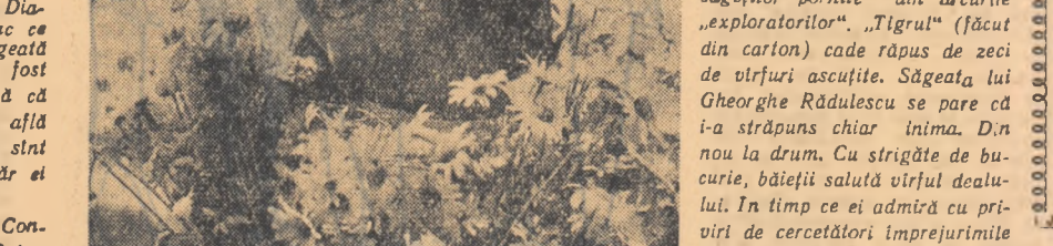
Intre dealurile ce adapostesc in curbatura lor Cmpoulungul Muscel se afla tabara de pionieri...