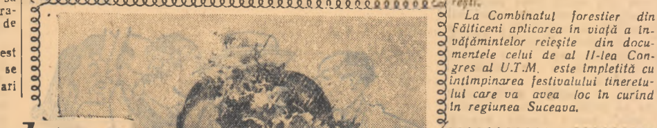
La Combinatul forestier din Falticeni aplicarea in viata a invatamintului...