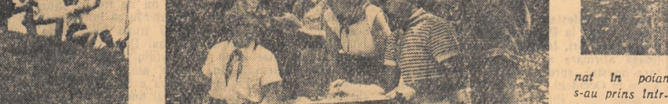
Intre dealurile ce adapostesc in curbatura lor Cmpoulungul Muscel se afla tabara de pionieri...