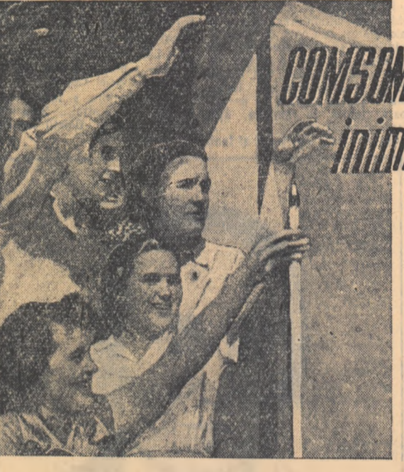
O nouă știință — Chemarea C. C. al P.C.U.S. și a Consiliului de Miniștri al U.R.S.S. adresată tineretului sovietic — a înviorat flacăra inimilor komsomoliste, a stîmplat un nou avînt în rîndurile tineretului sovietic. Noi — noi tineri sovietici simțim hotărîți să rediteze faptele de eroism ale komsomolștilor care au înălțat orașul Komsomolșk-pe-Amur, Magnitogorsk. Zărele sovietice, și mai ales „Komsomolșkaia pravda”, relatează zi de zi despre plecarea a noi detașamente de tineri, de komsomolști, pe șantierele celei de al 6-lea plan cincinal, pe noile șantiere din răsăritul și nordul țării.

Hotărîrea C.C. al P.M.R. și a Consiliului de Miniștri privitoare la îmbunătățirea învățămîntului de cultură generată din țara noastră e primită cu bucurie de cadrele noastre didactice. Întrucît ea creează condițiile apropierei învățămîntului de problemele