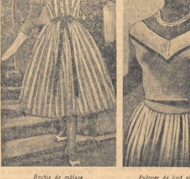
Rochie de mătase Pulover de lînă și fustă