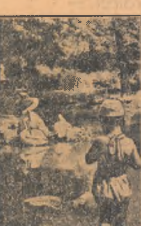
În Cișmigiu, într-un ungher discret, au poposit oaspeții din Delta pînă de curiozități a Duminecilor. Sînt cîteva exemplare minunate de pelicani, ce aluneacă grațios pe oglinda micului lac dinseru colțului zoologic. Sînt desigur mulți tineri naturaliști care s-au bucurat de sosirea acestor oaspeți pe care îi vor studia pe îndelete, dar cu siguranță că toți copiii saluți a voboase chiole aparăția pelicanelor în Cișmigiu.