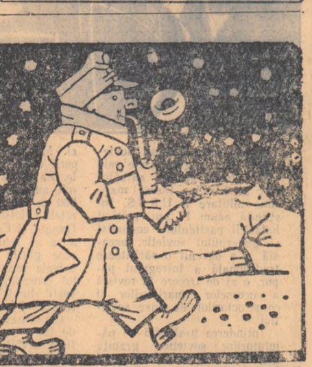
Sveik desenat de Iosif Lada