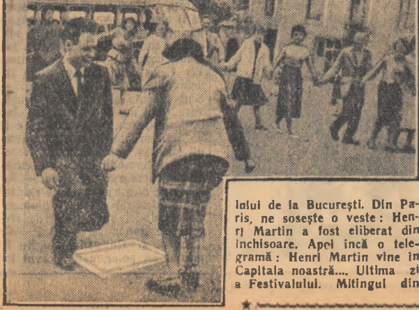
plaja 28 Martie. Zeci de mii de tineri din peste o sută de țări. La tribună îl recunoaștem pe vaînful marinar francez... Au trecut cîteva zile. Sala „Magheru” e arhiplină. S-au înfățișat în fața noastră un număr de tineri din România, care nu o dată ceruseră eliberarea lui, îl poartă pe brațe. De-abia pot să-l iau un interviu. Imposibil. Fiecare dorea să vorbească cu el. Alții doar: ne-am strîns miștile și mi-a spus: „Nu voi uita niciodată România”.