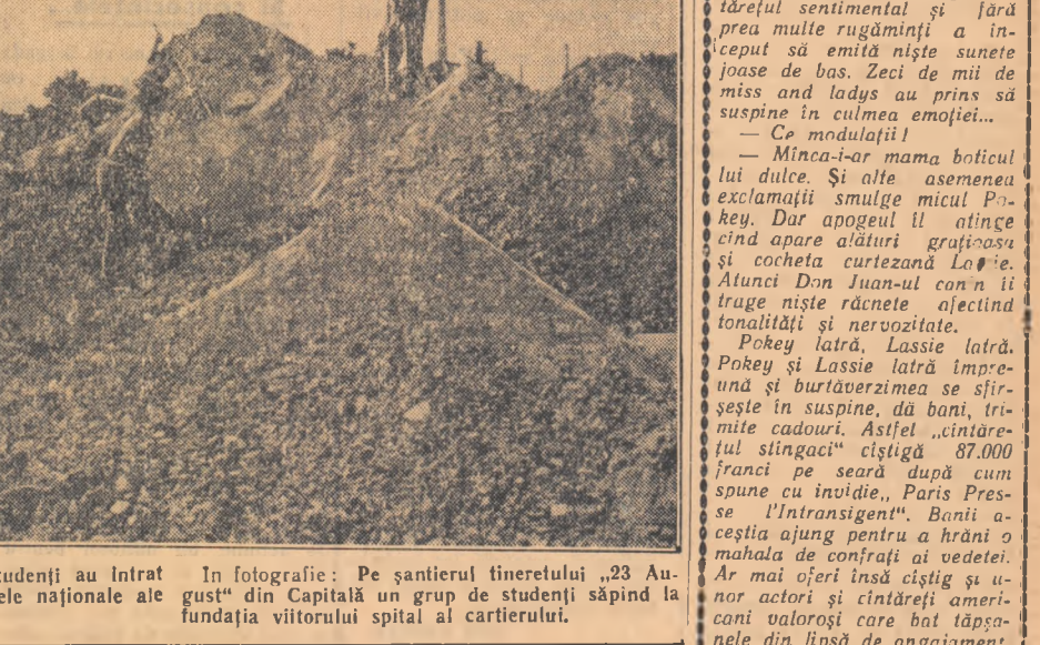
În timpul vacanței numeroși studenți au intrat în rândul brigadierilor pe șantierele naționale ale tineretului.

In fotografie: Pe șantierul tineretului „23 August” din Capitală un grup de studenți săpînd la fundația viitorului spital al cartierului.