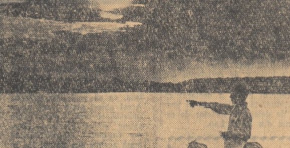
Peste lacul Amara s-a lăsat seara. Luna a unit malurile cu o punte de foc...