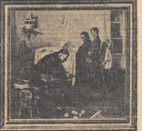
„Primul succes” de P. A. Oborin

Am ales două din aceste tablouri de gen pentru a vi le prezentăm. Cel dintîi („Primul succes” de P. A. Oborin) redă multitudinea simțămîntelor, unei mici artiște ce și-a deslășurat o clipă mai înainte talentul în fața unui public pe care nu-l vedem. Intensivitatea aplauzelor le putem însă descrie prin numai după emoția, șifșia și incitarea de pe fața ei, ci și după expresia celor ascunși în umbra cîșurilor. Rude, prieten, cunoscut, asistă curioș dar și mîndri de debutul promițător al micii artiște.