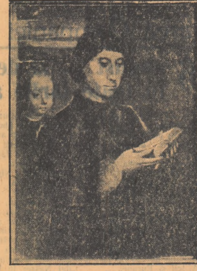
HANS MEMLING Portret de bărbat citînd

În ambele portrete se pot remarca darurile de pleșagist ale lui Memling care, așezîndu-și