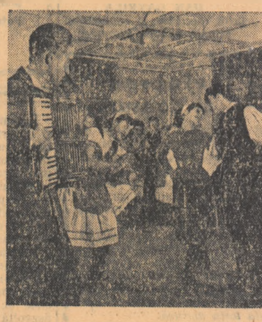
La clubul minei Petrila