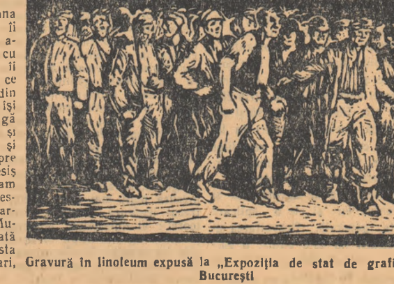
Gravură în linoleum expusă la „Expoziția de stat de grafică” București