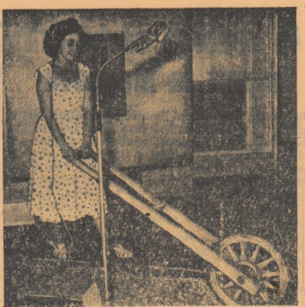
O roată cu pînteni plimbată pe alea cu pietriș din studio creează senzația sonoră a unui car cu bob.

Alcool 100 de părți, benzină 20 părți, eter 25 părți. Lichidele se amestecă într-o sticlă și se scutură bine înainte de întrebuințare.