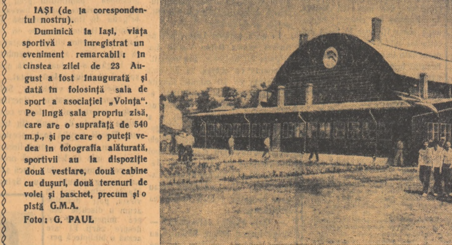
IAȘI (de la corespondenții noștri). Duminică la Iași, viața sportivă a înregistrat un eveniment remarcabil: în cinstea zilei de 23 August a fost inaugurată și dată în folosință sala de sport a asociației „Voința”. Pe lângă sala propriu zisă, care are o suprafață de 540 m.p., și pe care o puteți vedea în fotografia alăturată, sportivii au la dispoziție două vestiare, două cabine cu dușuri, două terenuri de volei și baschet, precum și o plstă G.M.A.