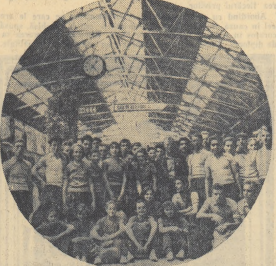
Gara de nord. Au sosit finalisții

— meci demonstrativ al lotului R.P.R. de volei; ora 17,25 — meci demonstrativ de handbal categoria A; Știința I.C.F.—Progresul Orașul Stalin (teren 1); ora 17,30 — meciuri de handbal etapa II-a (teren 2); ora 17,30 — meciuri de oină (terenul 3 și 4); ora 18,15 — meciuri de handbal etapa II-a (teren 1 și 2).