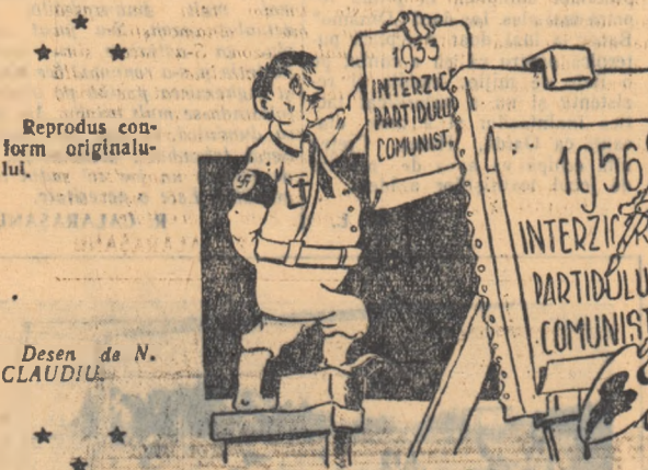
Reproduc conform originalului. Desen de N. CLAUDIU.