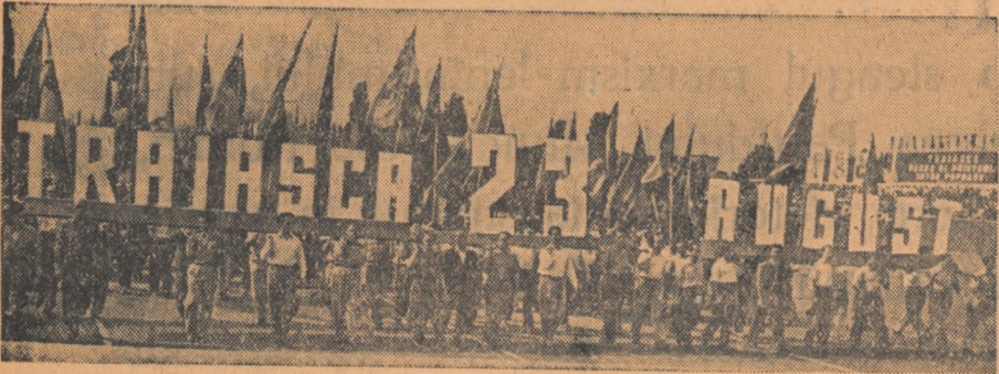
"Trăiască 23 August" — Cu aceste cuvinte inscrite pe un panou a început demonstrația oamenilor muncii.