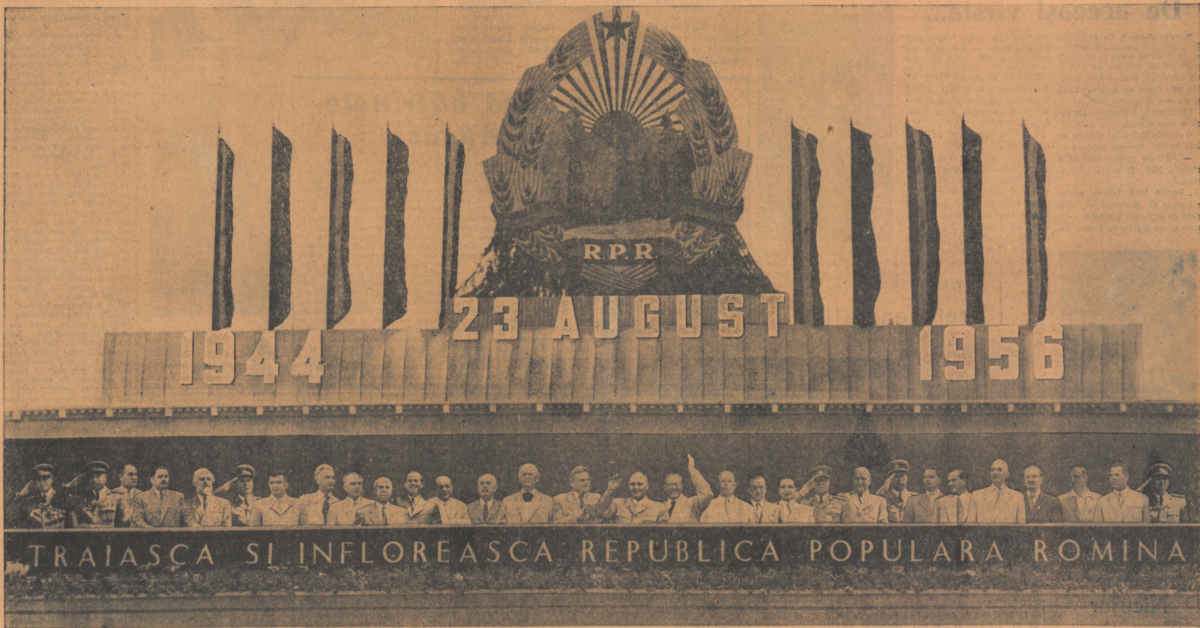
Un aspect al tribunei centrale

Sub steagul marxism-leninismului, sub conducerea Partidului Muncitoresc Român, înainte spre victoria socialismului în patria noastră scumpă!