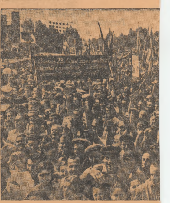
Sute de mîi de cetățeni ai Capitalei

Cine sînt fetele acestea, ce poartă coșuri pline cu roade pămîntului? Carolii cînt pumnul, roșii zemoase, mere dolof, ciorchini mari de struguri culești chiar azi... Toate sînt de G.A.S. Popești-Leordeni.