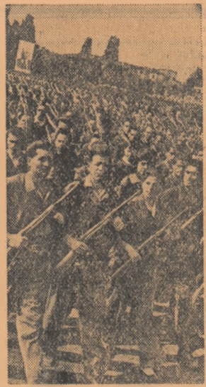
Defilează luptătorii din gîrziile patriotice. Ei au contribuit la 23 August 1944 la apărarea Bucureștiului...