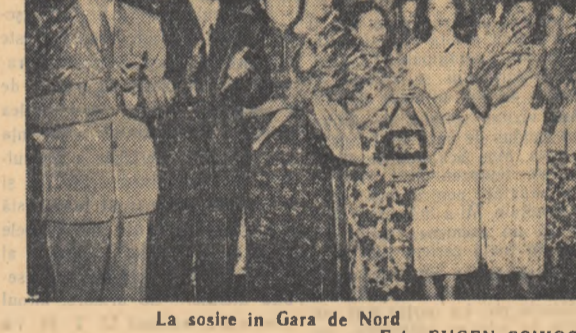
La sosire în Gara de Nord

Comunistul Ștefan Vizitiu a strîns o experiență bogată și folositoare pe șantierul de la Atenița la deslușirea ce ni le adădea, nici n-am știut cînd am