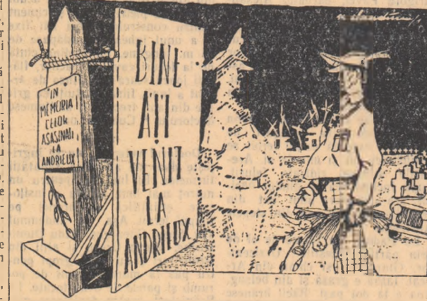
Umbră trecutul către „invitatul“ de acum: — Să știi că nu te-ai schimbat deloc între timp! Desen de N. CLAUDIU

UZU C. GEORGE PAVEL Prim locțiitor al procurorului general al R.P.R.