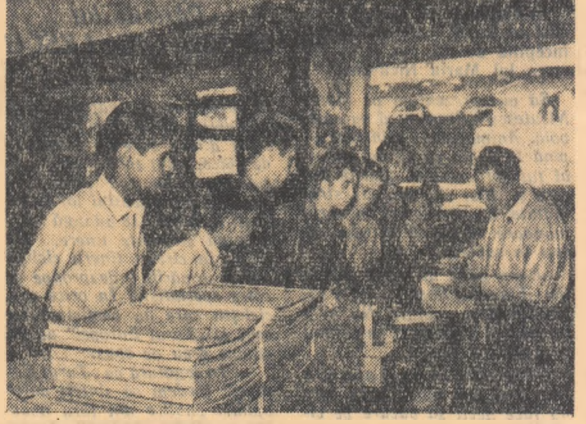
În preajma deschiderii noului an școlar, librăriile cunosc o aml mașic deosebită. Mărturie stă jozografa de mai sus făcută în „Librăria noastră” Tehnică din Capitală.