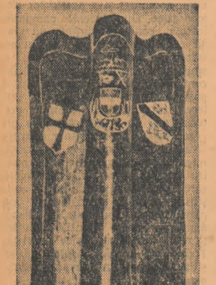
Scut al unui oștan din armata lui Ioan de Hunedoara.

Cucerirea otomană n-a făcut decât să întzească energiile creatoare ale poporului, printr-un regim de violență și exploatare,