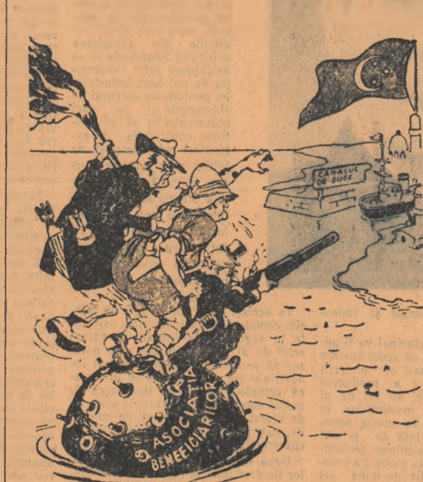
Mina plutoare a diplomației sau aportul occidental în problema Suezului