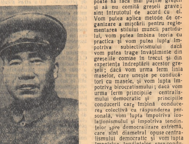
„Scînteia tineretului” Pag. 3-a 22 septembrie 1954

Paralel cu condițiile dinlăuntru țării, acualele condiții internaționale sînt de asemenea favorabile construcției noastre socialiste. Constatăm că după Congresul precedent al partidului nostru în situația internațională s-au produs schimbări uriașe și adînci. În cei 11 ani care au trecut, masele largi populare din diferite țări au lăunțat o mișcare de marea victorie în lupta împotriva imperialismului. Socialismul a ieșit deja din cadrul unei singure țări și țările socialiste cuprind în prezent o populație de 900 milioane. Ele formează din punct de vedere geografic o regiune unită, integrată, eie au creat marea familie a prieteniei și colaborării, în frunte cu Uniunea Sovietică. Datorită dezertei voluntari uriașe a mișcării pentru independența națională și datorită victoriilor obținute în această mișcare, în vaste regiuni din Asia și Africa au fost rulate lanțurile imperialismului ale inrobirii coloniale. Acțiunile eroice ale Egiptului, care a înlăunțat recent naționalizarea Companiei Canalului de Suez, s-au bucurat de sprijin hotărît în Asia, Africa și în alte regiuni ale lumii. Aceasta arată că avîntul nemaiîntîlnit al luptei anticoloniale continuă să crească, arată că mișcarea pentru independența națională a devenit deosebit de forțată în întreaga lume. Pe de altă parte, grupările reacționare din S.U.A. care tind nebunește spre dominația mondială, devin din ce în ce mai izolate, deoarece poli-