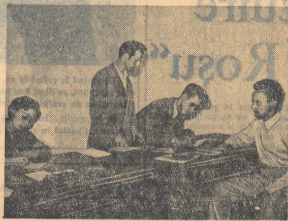
Un aspect de la înscrierile în asociații la Institutul Politehnic din București.

Cit mai mulți studenți membri ai asociațiilor