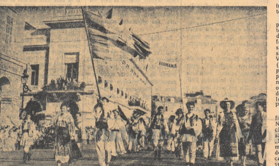
La defilarea participanților la festivalul folcloric internațional de la Nissa

Oricît de modești am vrea să fim, trebuie să spunem însă că a existat o deplină unanimitate de păreri în ceea ce privește nivelul înalt la care s-a prezentat grupul nostru Atunci cînd se anunța la microfon că numărul următor din program aparținea romînilor, publicul scotea un „aaa!” de satisfacție. Aplanzele izbucneau aproape întotdeauna chiar de la aparțința dansatorilor, ale căror costume fermecau pe spectatori. La sfîrșitul fiecărui dans urmau adesea ovățile. Foarte calde și entuziaste erau și aplauzele care publicul răsplătea orchestra noastră populară. Sint de neuitat cîndele cînd cele câteva mii de oameni își țineau răsuflarea ca să nu plardă nici o notă din cadența „Ciocirlile”. Nu se auzea atunci decît trîlul delicat al viorii și murmurul depărtat al mării. Cînd cadența