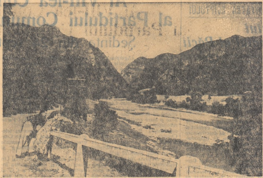
Frumusețea Oltului a încântat generații. L-au cîntat poezii și l-au descris cu mestegug reporterii. Valea Oltului este unul din cele mai pitorești locuri ale patriei noastre.

Ca rezultat al muncii de propagandă dusă în cadrul cercului, mulți cursanți, pe lângă faptul că își însușeau noi cunoștințe, munceau mai bine în producție, organizau mai bine locul de muncă.