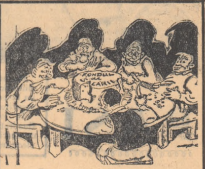
— Dă-i, mă, și ăsta o felie mai mare...

Pe șantierle naționale brigadierii primesc salarii după muncă. Din vina însă a unor elemente necinstite, pe unele șantiere și-au făcut loc practici ce trebuie lichidate. Unul din tovarășii care au participat la acest raid-ancheta, povestește: