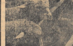
Gospodăria colectivă „Maxim Gorki” din comuna Gh. Lazăr, raionul Slobozia, are un sector zootehnic bine dezvoltat. În fotografie: ovinele produse în acest an în gospodărie.

Dacă regia și actorii se do cu cîntărea? Hotărît! Cel mai creator și eficient procedeu: contactul cu iiii pădurilor din Paltin, tăietorii, pădurarii și plușai, cărora filmul le este închinat. De la ei împrumută actorii cea notă de asprime, de duritate care le este caracteristică, dominantă în desfășurarea evenimentelor din film. Și ceea ce mai învață surtucarii din București, este să soarbă pînă în rîncuni aerul înmiresmat, purtat de vînt și distilat de răcoarea noapților cu brumă, primînd revarsările perdelor de ploaie ca pe niște mîngîieri de fată mare.