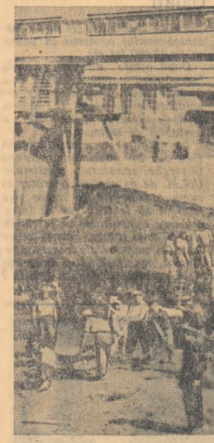
La Jilava se construiește un mare combinat al cauciucului. Aici, au venit să-și dea contribuția tinerii muncitori din toate colțurile țării E o mîndrie să îi brigadier pe șantierle tinerețului.

ducerea Trustului 4 a pretins că brigadierii nu sint muncitori obișnuiți, care trebuie angajați în procesul de producție ca orice muncitor salariat. Întreprinderile de construcții scutindu-se astfel de răspundere față de acești muncitori, au făcut, ca urmare, ca și unii din tineri să manifeste ușurință față de muncă,