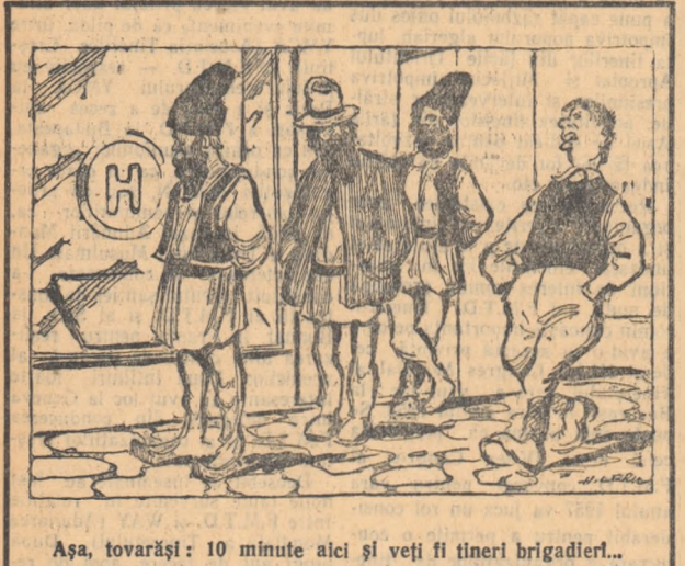
Așa, tovarășii: 10 minute aici și veți fi tineri brigadierii...

Așa poate fi, așa trebuie să fie și acum. Pentru aceasta e însă necesară preocuparea.