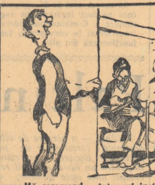
— Mă recomand: sint noul instructor... Cultural 17, sportiv 12... Nu, rațional!

Mobilizarea tineretului pe șantier e o problemă de mare perspectivă. Existînd grijă pentru lichidarea lipsurilor semnlate, făcîndu-se din recrutarea corespunzătoare și stabilizarea brigadierilor o chestiune de prestigiu a organizației noastre ca și a organelor Ministerului Construcțiilor, planul de stat al marilor lucrări încredințate tineretului va putea fi cu succes îndeplinit.