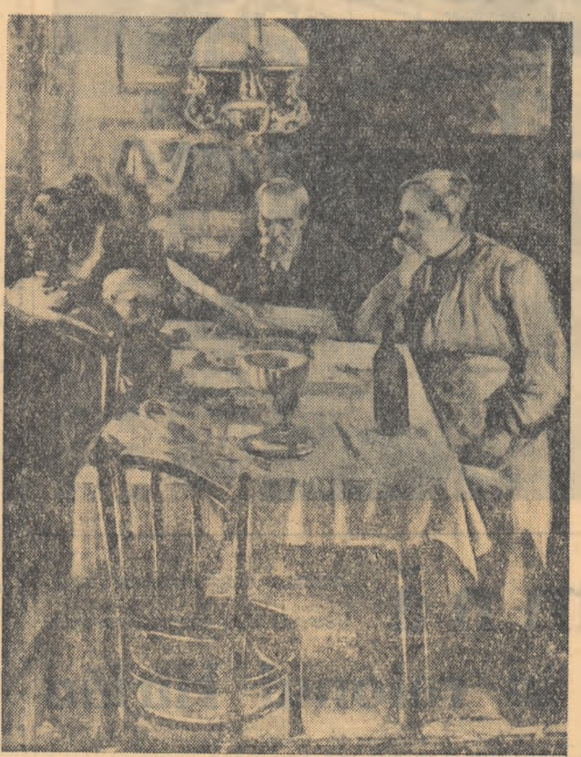
apărua interesele în artă. În publicațiile timpului, Vermont este elogiat adesea pentru talentul său de desenator, de fin colorist, maestru în redarea atmosferelor. Printre cele mai reușite picturi ale sale amintim: „Botezul”, „Bragagiul”, „In gară”, „Țigăncă cu coșul de rușe”. Nicolae Vermont a murit în 1932, lăstând moștenirea artei noastre se mindrește.

In colecția tezaurului de artă românească reintrors din Uniunea Sovietică se află și acest tablou aparținând lui Nicolae Vermont, de la a cărui naștere se împlinesc astăzi 90 de ani. Născut la Bacău într-o familie modestă în care toți copiii s-au dedicat slujirii culturii, Nicolae Vermont luaua în școala de arte frumoase condusă de Th. Aman, apoi la München unde înflințește pe Băncilă, Fritz Storck și Strimbu. Formându-se ca pictor cu o sensibilitate deosebită și plină de umanism, el se inspiră adesea din viața de fiecare zi a orașelor furtii și locuitorilor lor, din peisajul incântător al pămintului natal. Reprimarea singeroasă a răscoalelor fărâșești din 1907 îi dictează impresionante desene care văd lumina tiparului în revista „Viața socială”. Alături de Luchian organizează expoziția artiștilor independenți, în semn de protest împotriva autorităților, care încurajau doar pe cei care le