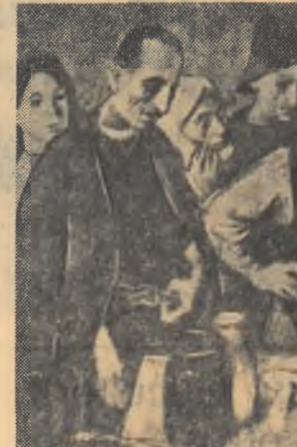
Eugen Crăciun "Cerc agrotehnic"

crează, pictorul caută să redea prin conturări cât mai vii și mai expresive, dar și prin întreaga ambianță de culoare și lumină, de reliefe și perspective, mișcarea sau acțiunea respectivă.