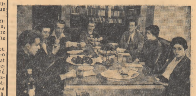
In vizită, la redacție

Recent a avut loc la redacția ziarului nostru o întîlnire cu lotul juniorilor de tenis de masă care a participat la campionatele europene de tenis de masă, la Paris. După cum se știe, cu acest prilej, tinerii noștri reprezentanți au reușit să câștige 4 din cele 5 titluri puse în joc. Pentru a informa mai amănunțit despre cele discutate cu acest prilej, redacția publică fragmente din stenograma discuției.