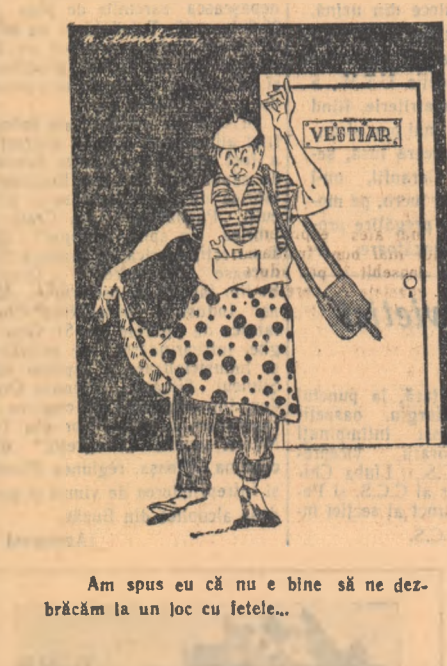
Am spus eu că nu e bine să ne dezbrăcăm la un loc cu fetele...

Posibilitatea cooperării în muncă, a executării muncilor în comun, constituie unul din marile avantaje de care beneficiază întovărășirile agricole față de micile gospodării țărănești individuale. Întovărășindu-se, membrii care posedă pămînt mai mult și brațe de muncă necorespunzătoare sînt ajutați de cei care au pămînt mai puțin și pot să lucreze mai mult, sau au brațe de muncă mai numeroase. În felul acesta țărani muncitori întovărășii execută la timp și în bune condiții lucrările agricole care necesită un mare volum de muncă și care nu admit întârzieri. Statutul model prevede că „membrii întovărășii care ajută alții membri la executarea diferitelor munci pe pămîntul acestora din întovărășire, care brațe de muncă, vite sau mașinile lor agricole, vor primi din partea acestora, pentru muncile executate, o plată în natură sau bani conform tarifului stabilit de adunarea generală a întovărășirii”.