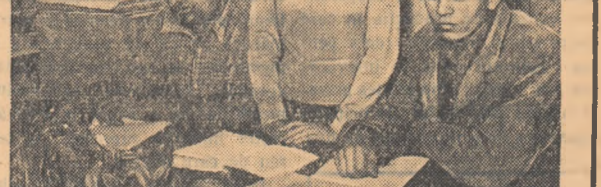
Unul din așele festivalului

„Grivița Roșie” — cetatea cefieriișilor. O zi obișnuită de muncă în care fiecare țîr și-a încredințat ca de obicei atenția pentru îndeplinirea sarcinilor sale în producție, pentru a da lucrul de cea mai bună calitate.