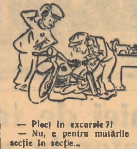
— Plec în excursie?! — Nu, e pentru mutările zilnice din secție în secție...

Consfătuirea a scos la iveală și a criticat cu asprime faptul că unii tineri nu și fac în mod