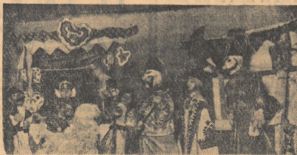
Scenă din „Matei Giscarul” în interpretarea Teatrului de păpuși din Cluj