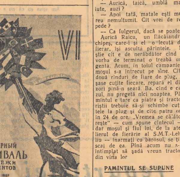
Unul din așele festivalului

În programul Festivalului sînt prevăzute cele mai variate manifestări — carnavaul tineretului, concursuri artistice, seminarii de literatură, cinematografice și altele. Va fi creat un club studențesc internațional în care se vor organiza tot felul de discuții.