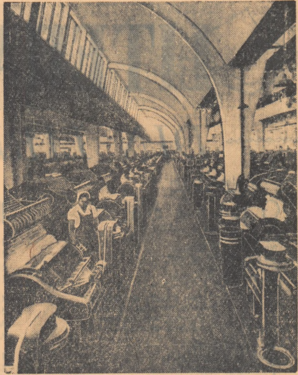
Uzina textilă „Moldova” din Botoșani este construită în anii puterii populare. Aceasta întreprindere modernă este înzestrată cu utilaj socialist din Uniunea Sovietică. Fotografia noastră înfățișează un aspect din secția carde a uzinei.