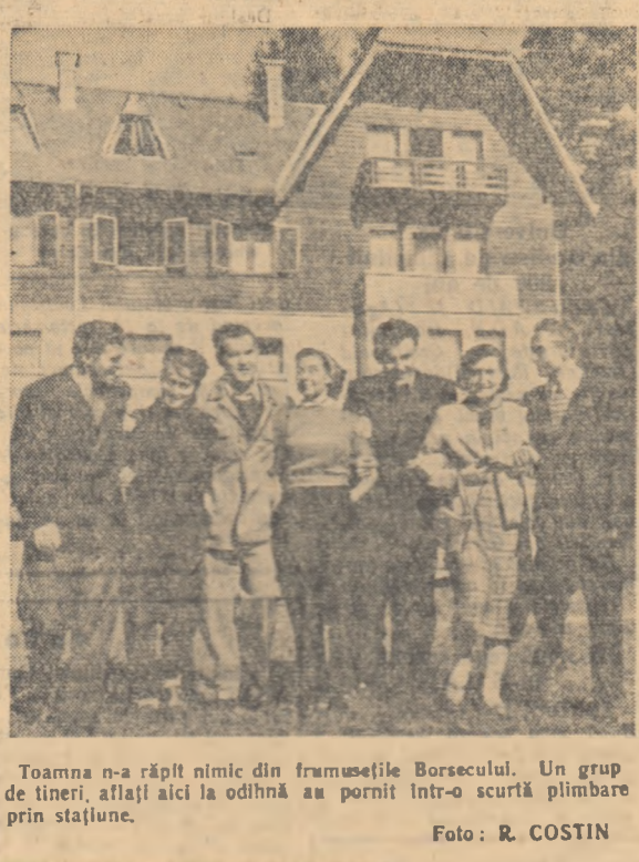
Toamna n-a răpit nimic din frumusețile Borsecului. Un grup de tineri, aflați aici la odihnă au pornit într-o scurtă plimbare prin stațiune.