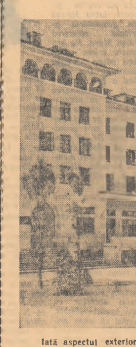
Iată aspectul exterior și dintr-o cameră de la căminul de fete nr. 1 al Institutului agronomic din București care deține drapelul de cămin fruntas.

„Știința tineretului” pag. 2-a 18 octombrie 1956