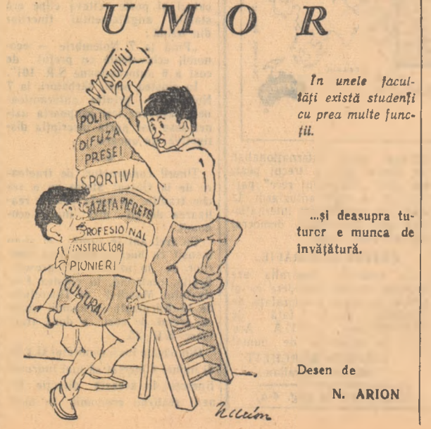
Desen de N. ARION

Și printre studenții Institutului politehnic mai persistă ideea eronată că un tehnician trebuie să se limiteze la domeniul lui de specialitate. Desigur în primul rînd calificarea în domeniul respectiv de activitate, dar nu numai atîl. Un intelectual trebuie să aibă un orizont larg. E trist faptul că din 2.000 de studenți ai Institutului politehnic doar 16 sînt purtători ai înșignei „Prieten al cărții”. Desigur că nu ne gîndim că doar acești cîteva studenți citeșc cărți în afara specialității lor, dar sîntem siguri că dacă comitetul U.T.M. ar fi dus o activitate mai susținută în această direcție nu s-ar mai fi întâmplat ca unii să citească maculatură apărută în colecția de tristă memorie de 15 lei.