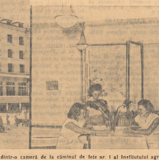
Iată aspectul exterior și dintr-o cameră de la căminul de fete nr. 1 al Institutului agronomic din București care deține drapelul de cămin fruntas.