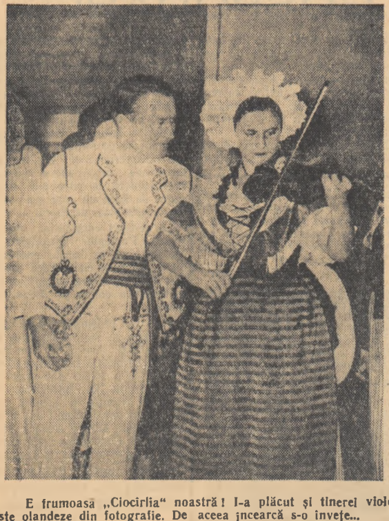
E frumoasă „Ciocirlia” noastră! I-a plăcut și tinerii violoniste olandeze din fotografie. De aceea încearcă s-o învețe...

„La sfîrșitul lunii august, am pornit spre casă. În sufletele noastre mîndria succesului se împletea cu bucuria că adusesem și noi o mică contribuție la o mai bună cunoaștere a țării noastre și a artei sale peste hotare. Ne-am înapoiat cu convingerea că astfel de schimburi culturale reprezintă un prețios aport la cauza înțelegerii și prieteniei dintre popoare.”