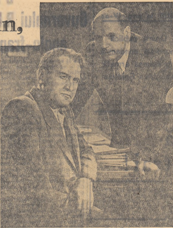
O scenă din film

După cum vedeți, raidul nostru a scos la iveală unele lipsuri ce se manifestă în raionul Brănești. Acestea, pe lângă alte deficiențe, au făcut ca însămînțările de toamnă să fie mult rămase în urmă. Pînă la 26 octombrie exclusiv, în întregul raion se însămînțase abia 44,70 la sută din plan. Pînă la aceeași dată, nici o comună nu terminase însămînțările.