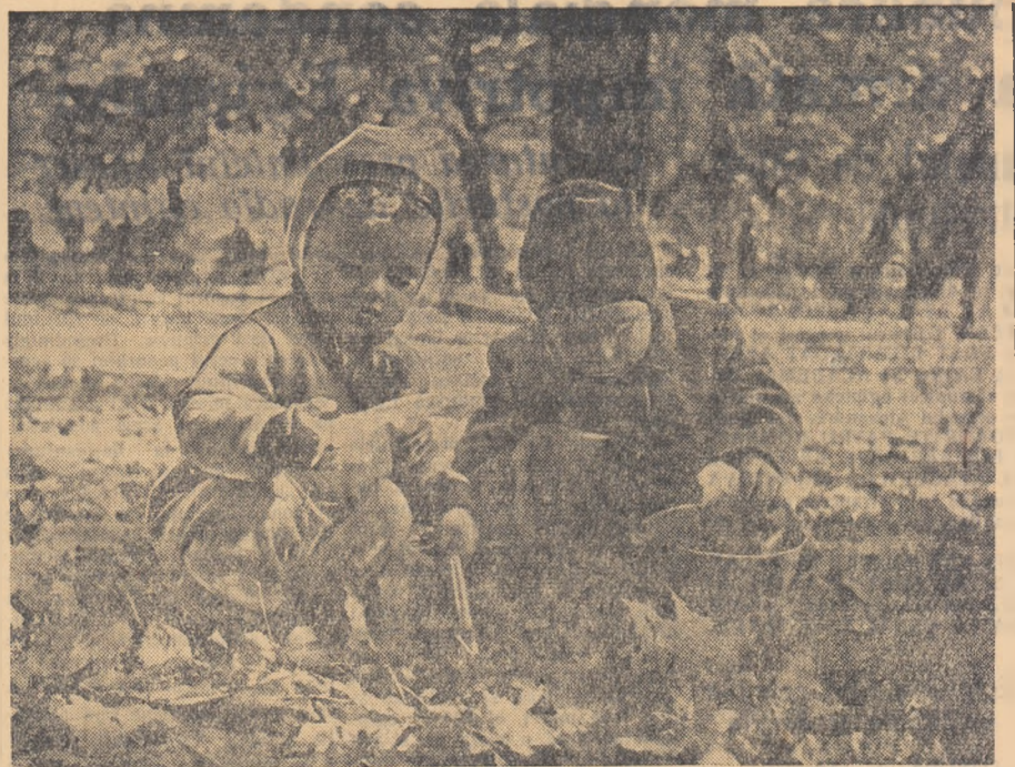
Bătrînul Cișmăbrăc haina de toamnă. A-lele, întinderea de lărbă, straturile de flori, solarile cu nisip s-au acoperit de manta ruginită a frunzelor căzute din belșug...