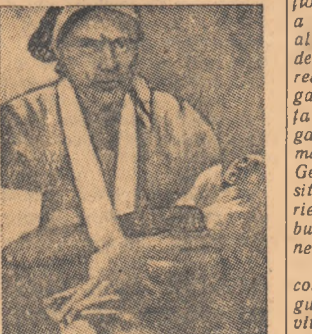
Aviația anglo-franceză a bombardat în mod barbar orașul Port-Said.

te în spatele cîtorva spitale care au rămas intacte în urma bombardamentelor. Două spitale au fost distruse complet de bombardamente. Aici — și-au găsit moartea 900 bolnavi care se aflau internat. Pot spune că calificative „acțiuni de ordin polițienești” rai-durile avioanelor deasupra străzilor și mitraliera caselor și