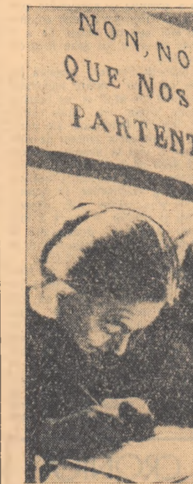
Comentariu și polemici • Comentariu și polemici

În fotografie: un aspect din timpul semnării protestului.