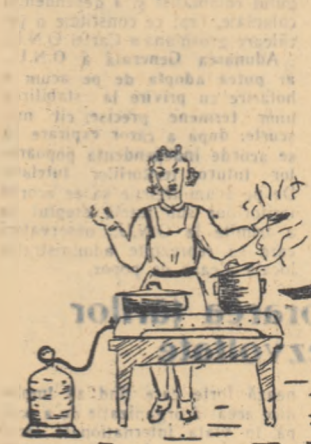
O supã bunã cere rãbdare...

merã cocotãtã la ultimul etaj al unei clãdiri de pe B-dul 6 Mar- te. Aici locuiesc 20 de fete, iar ca mobilier au 19 (1) paturi, 6 șifoniere, un spãlator, cu țel chiuvetã și o salã micã înzestrãtã cu un reșou de arãgaz, care de- serveste toate locãrile plus fa- milia mecanicului șef de la fa- bricã. De doi ani este înființat acest cãmin și prea puține îmbun- tãțirile au fost aduse în acest timp.