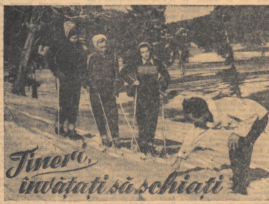
Jinerii învățați să schiați

NUMAI CITEVA ZILE NE MAI DESPART PÎNĂ LA STARTUL PRIMELOR ÎNTRERECI DE SCHI. ȘAH. GIMNASTICA ETC. ALE GATIȚI-VA PENTRU CONCURSURI, ÎNVĂȚAȚI SA SCHIAȚI!