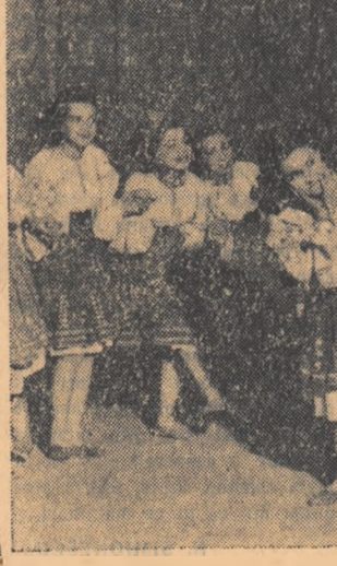
Din activitatea Școlii populare de artă din București.

Pină anul acesta, școlile populare de artă aveau mari neajunsuri organizatorice, dar mai ales existau aici confuzii în ce privește profilul învățămîntului ce se preda, gradul de cunoștințe cu care trebuiau să iasă elevii. În multe locuri învățămîntul artistic era făcut pe baze meșteșugărești. Nu de puține ori se întimpla să se treacă cu vederea scopul principal pentru care erau pregătii aici elevii, profesorii incurjîndu-l mulți tineri tendințele timpurii de profesionalizare, cu totul dăunătoare. Îndată ce ajungeau în rîndul figuranților de teatru, de pildă, aceste tinere „vedete” părăseau școala populară, încercînd să „prîndă” meșteșugul actoricesc mai direct, de pe scenă. Înainte de a ajunge actori însă, ei începeau să joace