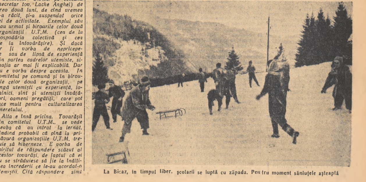
La Bicaș, în timpul liber, școlarii se luptă cu zăpada. Pentru moment săniuțele așteaptă