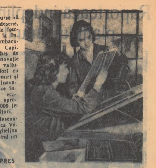
Preocupându-se să creeze noi desene, colectivul de fotografare de la Industria Bumbacului A din Capitală a introdus de curând o inovație în gravatul valurilor de culori cu efecte din tonuri și semntonuri, inovație care aduce în treptărilor economice de aproximativ 350.000 lei la 50 de valuri.

...am intrat în teren în timp ce se juca meciul. După câteva ore m-am dus la meci amestec.