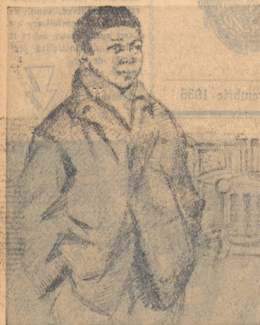
Desen de TIA PELZ