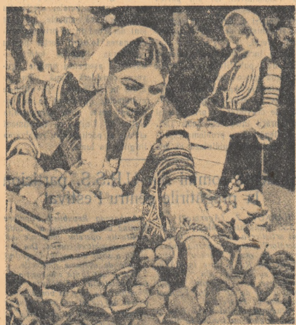
Tineri din R. P. Bulgaria la culesul fructelor

De curînd, o delegație a C.C. al U.T.M., a făcut o vizită în R.P. Bulgaria, pentru a studia unele aspecte din munca tineretului bulgar, precum și experiența organizației revoluționare a tineretului bulgar, D.S.N.M., în cooperativizarea agriculturii. În articolul de față sînt relatate cîteva lucruri văzute de membrii delegației.