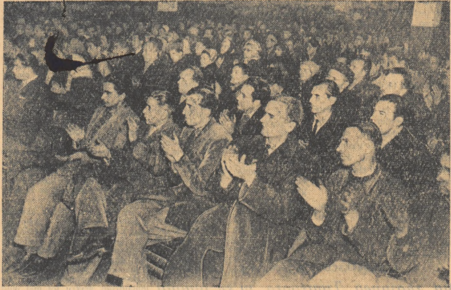
Oamenii muncii participă în număr mare la adunările de propunere a candidaților F.D.P. În clișeu — un aspect de la adunarea ce a avut loc la uzinele „Mao Tze-dun“.