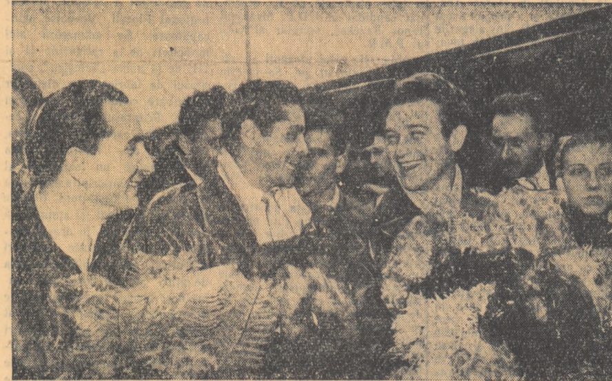
In fotografie: Un aspect de la sosirea olimpicienilor noștri de la Melbourne.