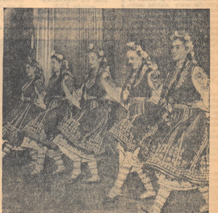
Spectacolul Ansamblului artistic bulgar „V. Maikovski” la Teatrul Armatei