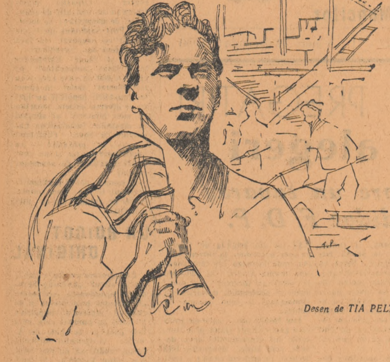
Desen de TIA PELTZ