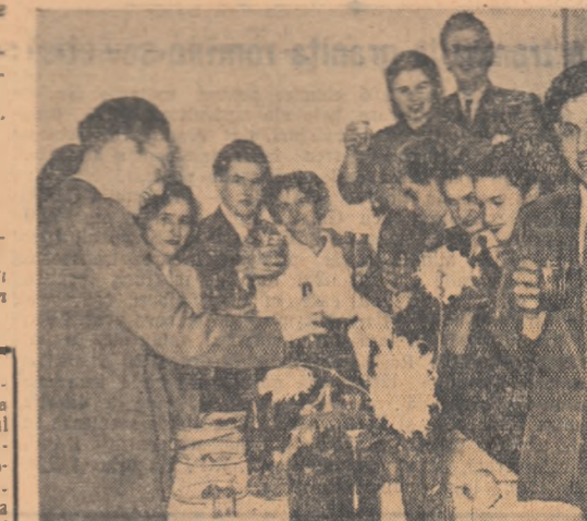
Primele clipe ale unui nou. Sînt pline paharele într-un cuventul toast?

Ne aflăm în Casa Universitarilor din Cluj. Aici mîniță, dibace ale studenților un împodobit cu mîniță și bine lățele pomii de lîngă pregătire pentru examen. Cînd cîntărea orărea în 2. grupuri-gazdă de studenți frunțași români, maghiari și germani, precum și studenți din țările de democrație populară care studiază la Cluj au început să intre în sală. Studenții organizatori și revelionul cu cântec din timp mai devreme cu mîniță și băuturi. Instrumentele muzicale așteptă în un colț la așteptare și se așteptă. Dansul a început cu un vals. Apoi un tangou, glume, risete, veselie. Ora 12 noaptea! — La mulți ani! — Mulți ani fericiti! Sa felicitau reciproc studenții de la toate facultățile. În mijlocul lor a venit acum academicianul Constantin Daicoviciu, rectorul Universității „Victor Babeș”. În cuvînte pline de căldură el le-a urat studenților ani mulți și fericiti și noi succese pe drumul atingerii de noi studenți în rîndurile frunțașilor la învățătură.