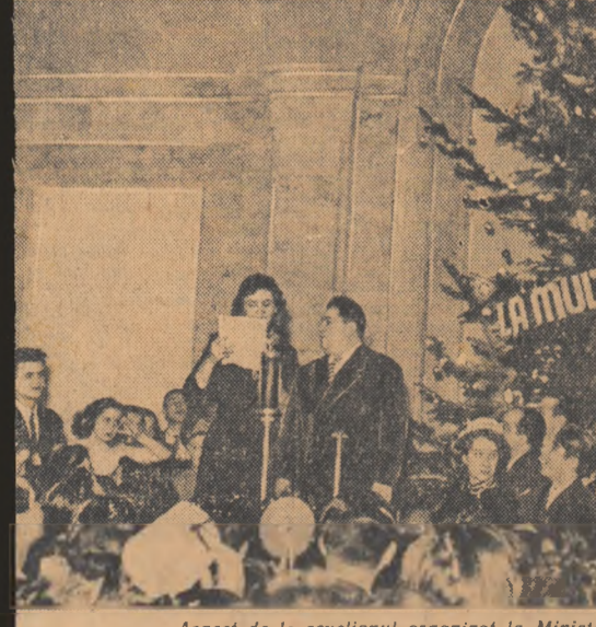
Aspect de la revelionul organizat la Ministerul Culturii

șile prietenii încercate în nuncă, sentimentele toată- reștii au fost principalii și ai revelionului. Mulți cei care și-au căutat to- cu care se află în între- pentru a ciocni cu ei cupa plină de vinul scînteie- tor. Tinerii obișnuși ai schelelor de construcție au fost printre a- cestia. La Galați, brigadierii, cet- care construesc și reconstruesc orașul de pe malurile Dunării, au fost împreună în această noapte. In locul mistriților — paharele pline. Au ascultat cîntecul și cuplele așterite de artiștii Teat- rului de Stat, au cîntat ei înșiși și și-au spus glume, au dansat, au făcut tot ce este în obiceiul unui revelion, dar, peste toate a- cestea fiecare simțea o sudură intimă cu toți ceilalți, pornită din deprinderea de a simți zilnic co- tul vecinului în colțoaia care se îndreaptă spre șantier. Aceasta este o lege nescriasă dar puternică a societății noas- tre. De la familia care petrece de una singură, oasă între ne- reștii binecunoscuți, de la reu- nea ditoroa prietenii, noi cunoaș-