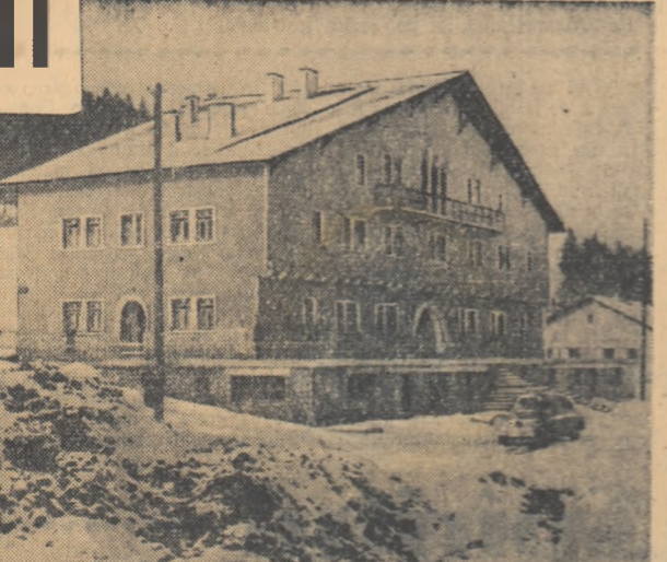
În clădirea nouă, spațioasă, a spitalului din satul Pietrosu, comuna Zemeș, muncitorii găsesc toate cele necesare unei asistențe medicale de bună calitate.

Deces Și-a dat sufletul revista americană „Collier's” născută în 1888. Motivul decesului este lipsa de reclame cauzată de scăderea prestigiului revistei în urma luptărilor cu cititorii ocolesc. După cum se știe, „Collier's” a fost în timpul vieții sale una din oficinele „războiului rece”, fapt care a și dus la îndepărtarea de ea a cititorilor sătuli de minciună pe care le promova în paginile sale. Ea a fost aceea care a publicat acum cîțiva ani, în proză sau în poezie, un număr special unde se „prevedea” ce se va întâmpla cî Moscova duce răz și... o curvă de americană. Ștm că și alti mare propagandă anti-sovietică, Gaebbe, a „prezis” nu o dată intrarea sovieticilor hitleristi în capitala sovietică. Unde a ajuns acest prezicător — se știe. Alți prezicători li urmează acum. Mal sint amatori? D. L.