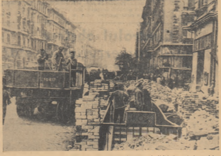
BUDAPEȘTA AZI: Muncitorii unguri lucrează la refacerea unei clădiri din centrul orașului