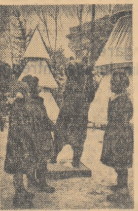
Fiorosul urs se oferă binevoitor ca... decor fotografic

Dar să nu pierdem vremea. Avem multe, baltă pe itinerariul nostru din minuscula urbe. Iată o toabă uriasă. În stăpela ei un chioșc. Copiilor le scilpesc ochii: aci se vînd jucării. Două pași mai încolo un chioșc, domănit de o scoitoare și cîteva vînturi de creioane colorate. Popasul e mai lung pentru școlarii. Un miros plăcut îți gidilă nările. În lața ochilor îți apare un cuport imens din cărămidă roșie. Cînd observi în gura cuportului cițiva bărbăți și femei te oprești o clipă mirat și chiar... puțin speriat. Gogoșile pe care le poți cumpăra de la acești oameni în halate albe îți alungă sperietura și, bineînțeles, prelungesc popasul. Călătorului tăi însă bine cu drumul, așa încît... Poposim în lața unei cărți neobișnuit de mari pe paginile căreia descifrăm cîteva cu-