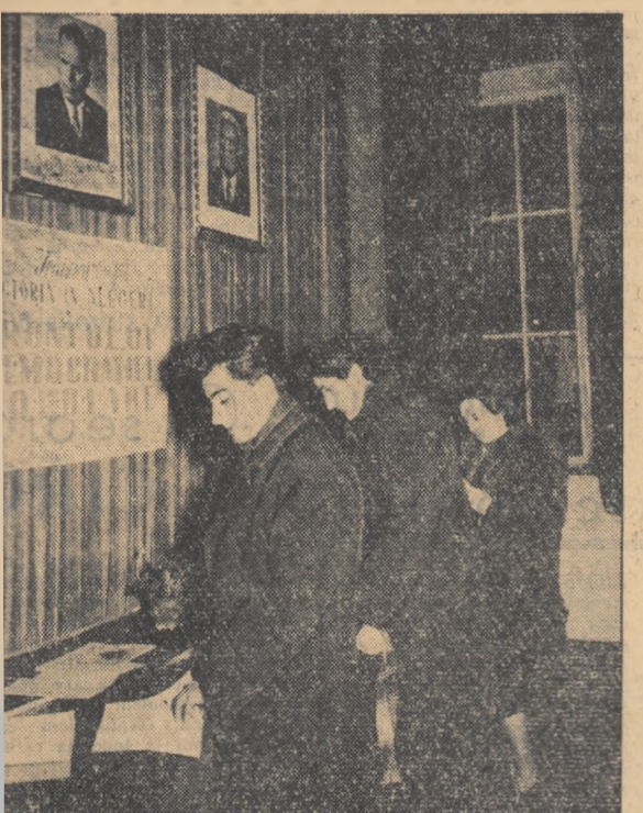
La Casa alegătorului de la I.S.E.P. un număr însemnat de cetățeni vin zilnic să cerceteze dacă sînt trecuți pe listele de alegători.

sa cum prevede Legea pentru alegerea deputaților în Marea Adunare Națională, 30 de zile înainte de data azerilor s-au terminat în întreaga țară lucrările pentru înscrierea în listele de alegători a cetățenilor care au drept de vot. Au fost înscrise în aceste liste peste 800.000 de cetățeni.