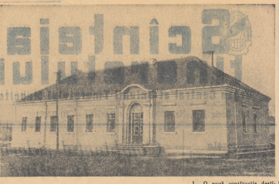
O nouă construcție destinată muncitorilor de la Intreprinderea pentru Industrializarea căminii din Burdujeni: dispensarul medical.