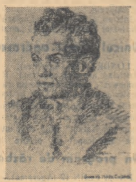
despre influența acestuia asupra poeziei sale. Mi-au rămas neșterse în memoria, de atunci, cuvintele lui. Poezia populară — spune Beniuc — este plămâniul spiritual al poporului, mărturisind că prin acest plămân respiră și versurile sale.

Acad. Mihai Beniuc, candidat al F. D. P. vesel, tineresc — în intervalul dintre o horă ardelenească și o străbătuță-n poezie, — dacă nu aceea a unei jirești și spontane prețurii? Luna reoștului apoi la Cluj. Venise printre noi, studenții, care-l învoiam slogan mai „sistematic“ (dădeam examene și luam note). În aula Universității „Victor Babeș“, el ne-a vorbit cu pasiune despre poezia sa, despre creația literară a poporului nostru.