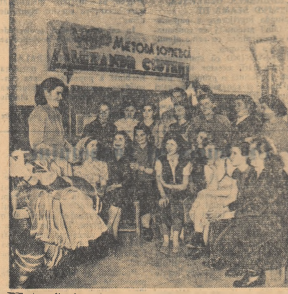
Fotografia de mai sus înfăș...