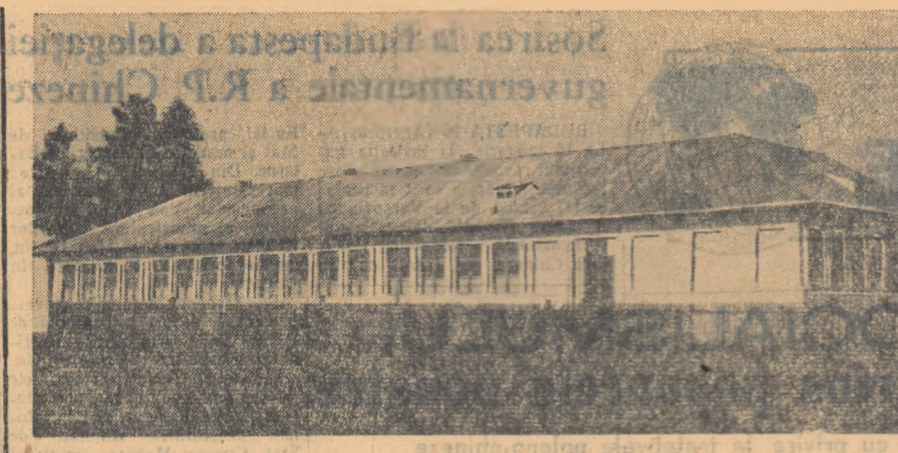
Analfabetismul și obscurantismul în care au fost...