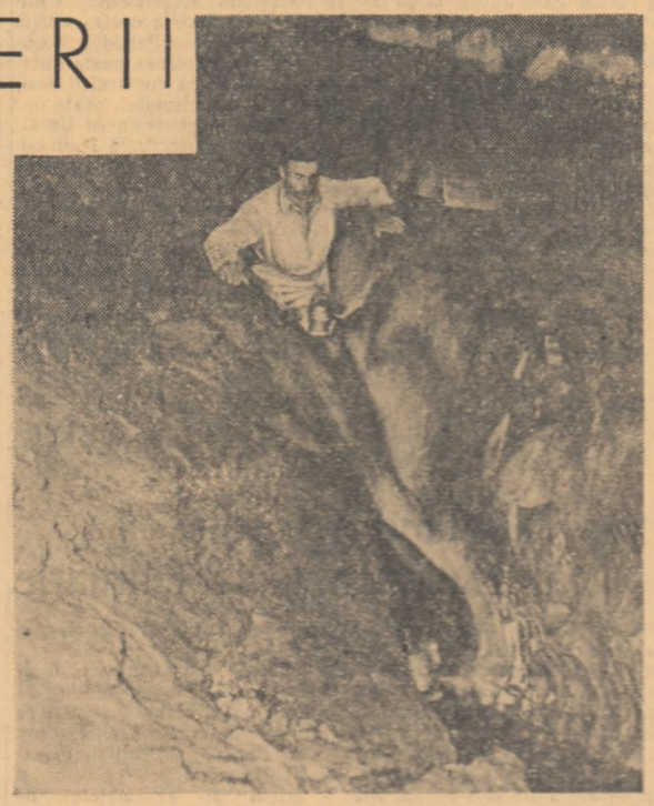
restrucit și cred că vom putea continua drumul.