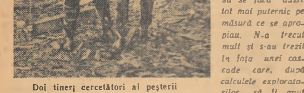
Doi tineri cercetători ai peșterii