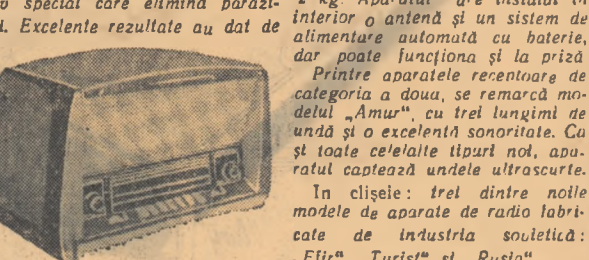
„Eterul” este înzestrat cu o antenă încorporată...