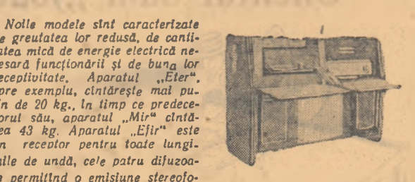
„Eterul” este înzestrat cu o antenă încorporată...