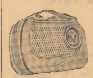
Notte modele sînt caracterizate de greutatea lor redusă...