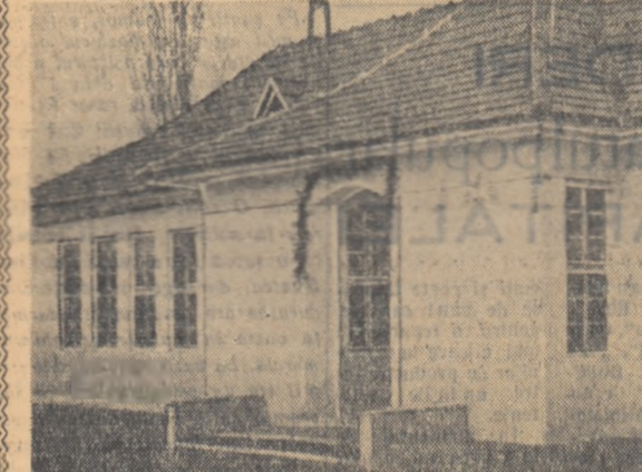
Clasele școlii elementare de 7 ani din comuna Coșca Mică... Mare a fost bucuria școlărilor când pe data...