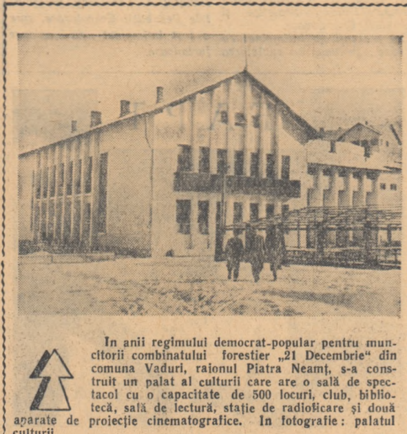
În anii regimului democrat-popular pentru muncitorii comunisti, raionul Platina Neamț, s-a construit un palat al culturii care are o sală de spectacol cu o capacitate de 500 locuri, club bibliotecă, sală de lectură, stație de radiofonică și două aparate de proiectie cinematografice. În fotografie: palatul culturii.

Ce s-a întimplat cu Mortul Romîn? Cum de a decedat în așa hal? Unde-i constituția lui cetățenească? Unde-i oera lui politică? Unde-i marea său talent oratoric? Am tot dreptul să fiu nălnițit de starea Mortului Romîn.