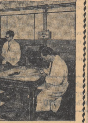
Se lucrează la aparatul pentru măsurarea cu mare precizie a cîmpului magnetic prin metoda rezonanței magnetice nucleare. Aparatul va fi folosit la reglarea ciclotronului.

Încredere! În neîncăpătoare sala de clasă domnea încrederea. Bună e legea cea nouă a partidului — spunea jîranii, referindu-se la Hotărîrile plenary din 27-29 decembrie 1956 a C.C. al P.M.R. De acum, tovarăși, să vedeți cum o să zboare plugul nostru! Și nu era aceasta o simplă corbă. Umblasen pe lungi drumuri, la Șomcuta și la Sighet, la Negrești și la Medieșu Aurii, în Satu-Mare și pretutindeni cîmpurile adormite sub troienele trezirău la tropotul căldurii venau aici înhămați la căruțele cu îngrijămintă. Tropotul acesta îndușit în zăpăz străbătute întreaga țară. Gunoitul cîmpurilor într-o proporție necunoscută încă pînă acum, într-un asalt necunoscut încă pînă acum — iată primele semne ale recoltei de aur, care neîndoielnic se va tot sub bolta lui 1957. Astfel va fi prăznuit neuitatul, eroicul 1907. La o jumătate de veac de la răscoală, singele acura atunci în pămîntul mașierilor va ridica, preschimbînd în seacă, tulpini bogate deasupra pămîntului colectivizărilor și întocăriturilor.