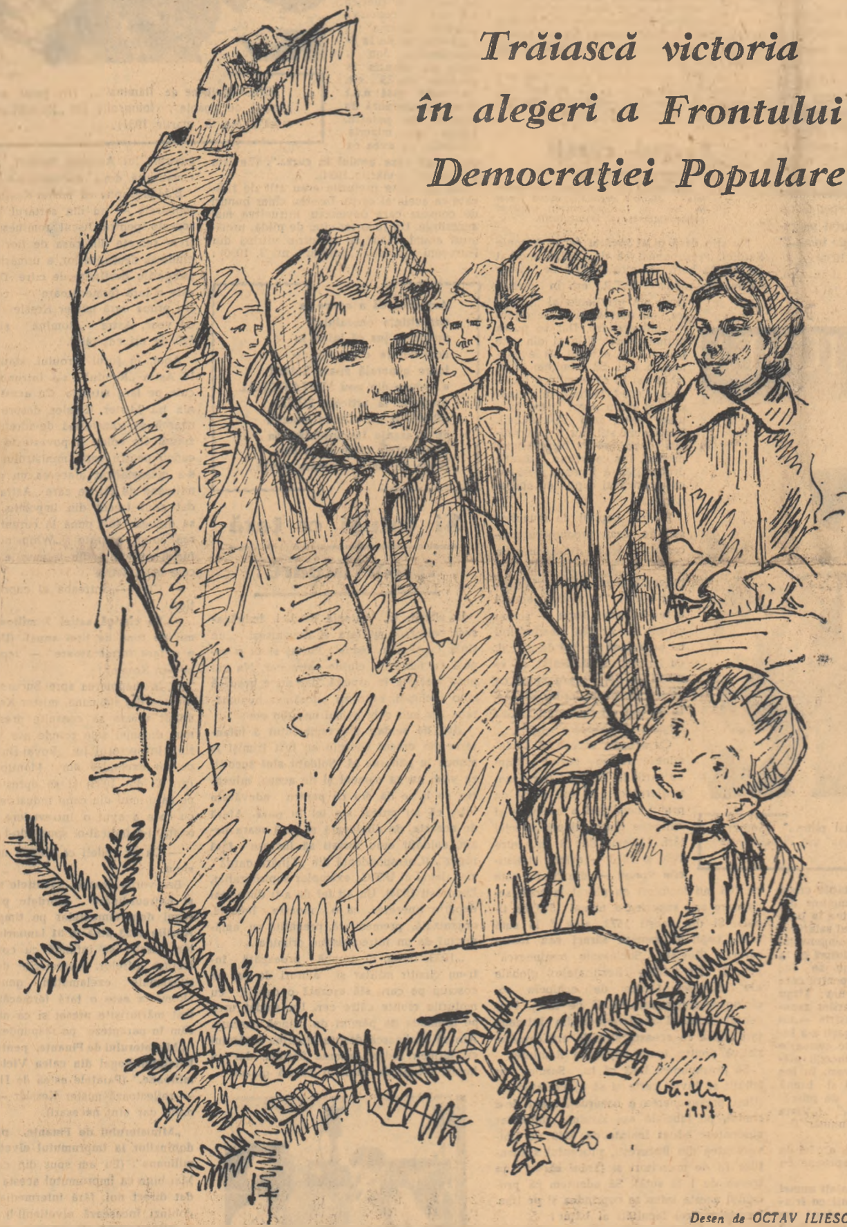
Desen de OCTAV ILIESCU