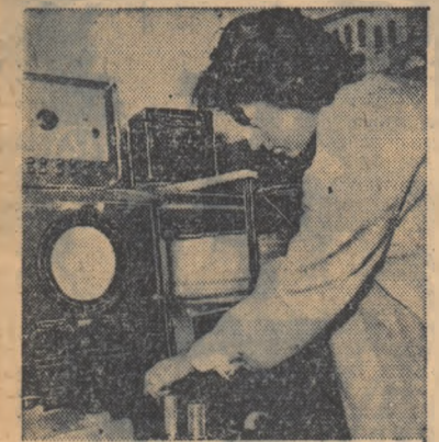
Cercetătorii urmăresc la hodoscop înregistrarea unor particule din raze cosmice.

Sint cîțiva ani de cînd, într-o iarnă primăvară, pe un autocamion încărcat cu merinde, am făcut prima mea călătorie în lumea atomului. Pe măsură ce urcam spre munte, drumul modest de țară, dăltuț de ciocane pneumatice și călcat ca o panglică de ruloare compresoare, se transforma într-o neașteptată autostradă modernă. Limuzine negre și autobuse de culoarea cafelei, concureau călușii localnici. Din loc în loc, casele țărănești începeau să ofere în locul pridurilor, decupașii dreptunghiulari al unor vitrine de magazin, rod al unei urbanizări recente și originale. Peisajul amintit, o barieră, la dreapta și la stînga cadrului