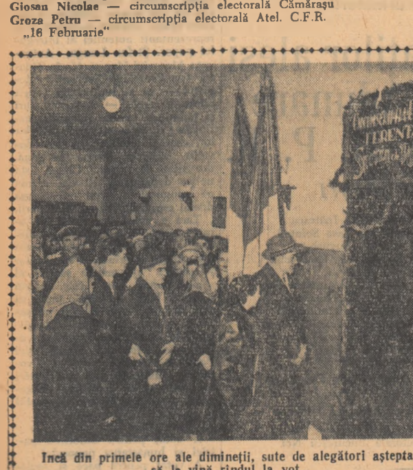
Încă din primele ore ale dimineții, sute de alegători așteptau să le vină rîndul la vot...