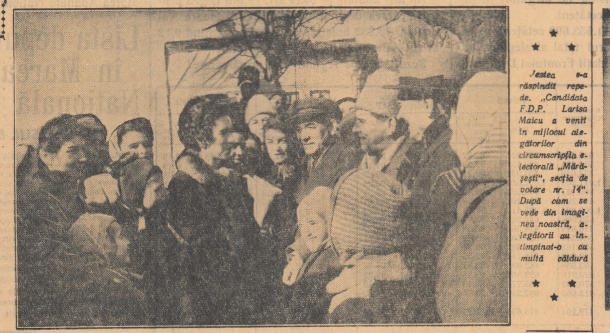
Încă din primele ore ale dimineții, sute de alegători așteptau să le vină rîndul la vot...