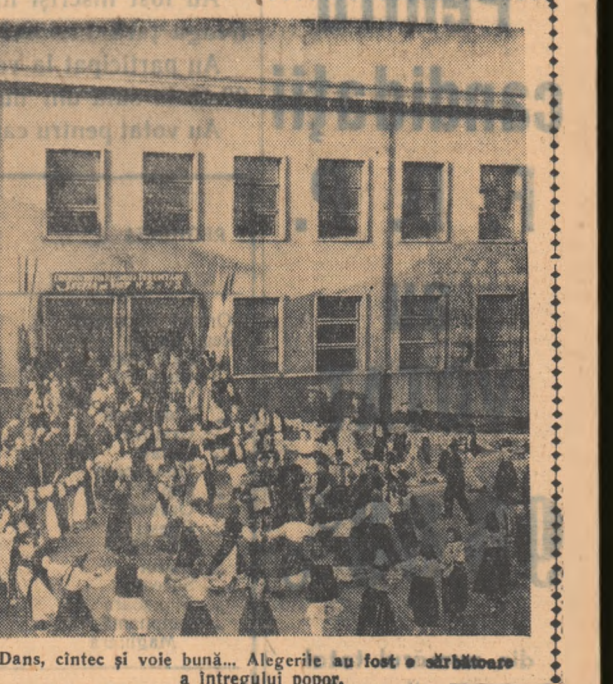
Dans, cîntec și voie bună... Alegerile au fost o sărbătoare a întregului popor.