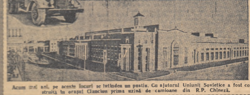
Acum trei ani, pe aceste locuri se întindea un pustiu. Cu ajutorul Uniunii Sovietice a fost construită în orașul Cianciun prima uzină de camioane din R.P. Chineză.

Specialiștii sovietici împărtășesc cu dragoste din experiența lor tehnicilor și inginerilor chinezi