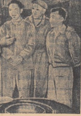
Specialiștii sovietici împărtășesc cu dragoste din experiența lor tehnicilor și inginerilor chinezi

Cu prilejul împlinirii a 7 ani de la semnarea Tratatului de prietenie, alianță și asistență