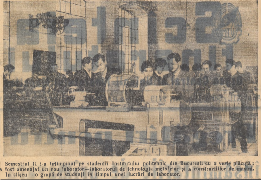
Semestrul II l-a întîmpinat pe studenții Institutului politehnic din București cu o veste plăcută: laboratorul de tehnologia metalelor și a construcțiilor de mașini. În clișeu: o grupă de studenți

Începutul semestrului II... Revăd în închipuire munca noastră și mă gândesc că nu ne-am priceput să folosim îndeajuns forța educativă a celor aproape o sută de cadre ale organizației U.T.M. din facultatea noastră care doresc sincer să muncească viu, cu oamenii, și pe care noi le picăsim uneori cu sarcini-sablon și acțiuni formale. Gîndindu-mă la activul U.T.M. din facultate, am înțeles că avem oameni în stare să nu plardă din vedere scopul, perspectiva muncii.