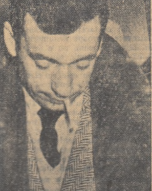
Yves Montand scriind cîteva cuvinte pentru cititorii noștri

ferință de presă la Casa ziaristilor. Îi dispărușeră urmele de oboacă de pe față. Se dovedi curînd un interlocutor deosebit de plăcut, colubil, cu o bună dispoziție molipsitoare. Glumea, gesturile larg, mima, participa intens la concorbirea amicală cu ziaristii. Întrebări multe, pe teme variate: de la stiluri în muzica populară franceză la șansonetii celebre, despre filmele în care joacă, și munca cu colaboratorii, în legătură cu părerea sale asupra publicului socialist („Poporul socialist este extraordinar, publicul generos, primitor”) sau despre numeroasele scrieri pe care le primește. Din gama bogată a întrebărilor n-a lipsit nici clasică: „cum sînt proiectele de viitor?” Răspunsul a fost interesant: un film despre pescarii italieni pe care îl va turpa în Sardinia și — în pregătire — un nou recital la Paris. Conferința de presă a avut un final original: un cîntec rominească înregistrat pe bandă de magnetofon dedicat întâlnirii bucureștenilor cu Yves Montand. Apoi, ga-roaște roșii și din nou autografe (cineva afirmă că de astă dată — pentru colecțiile personale ale ziaristilor). Și, fără să cînte (măceșă companiatorii și era obosiți) a cules ropote de aplauze la... scenă deschisă.