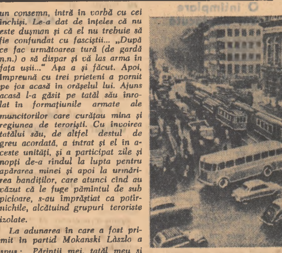
Budapesta, ianuarie Pe strada Nagy Kőrut