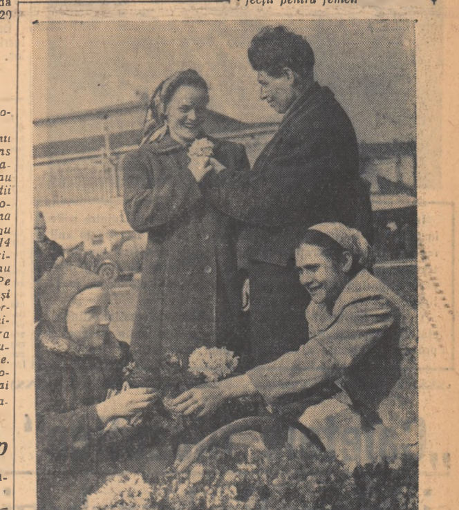
PRIMII GHIOCEL...